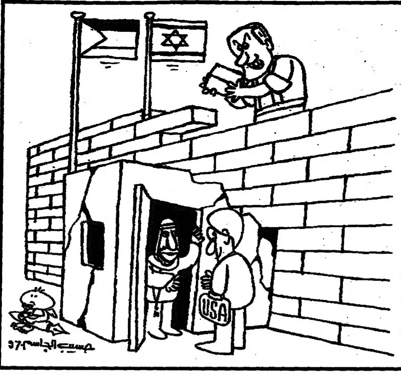
مسيرة الجاسم 97